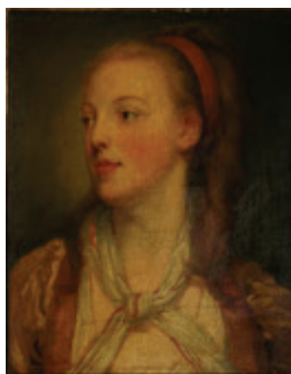
Dama con cinta roja, s.f.