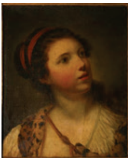
Jean-Baptiste Greuze Dama con atuendo de caza, s.f.