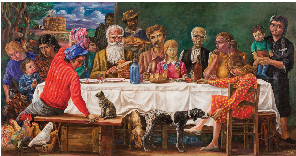
Antonio Berni Domingo en la chacra o El almuerzo, 1945-1971

¿Tenés un álbum familiar? ¿o son fotos sueltas? ¿están en papel o en una compu? ¿son fotos posadas o espontaneas? ¿son momentos especiales? ¿que momentos? Con el tiempo la forma de retratar personas y reuniones familiares va cambiando pero siempre persiste la intención de guardar el recuerdo.