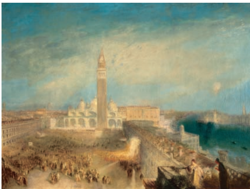
Joseph Mallord William Turner Juliet and her Nurse (Julietta y su aya), 1836.