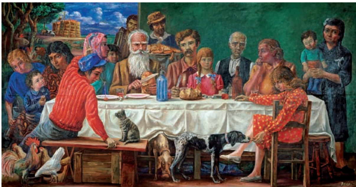
Antonio Berni Domingo en la chacra o El almuerzo , 1945-1971.

El recorrido nacional sigue un guión temático-cronológico, a través del cual algunas de las problemáticas del arte argentino de los siglos XIX y XX articulan las distintas salas de exposición distribuidas en cuatro plantas del edificio. Con obras de importantes artistas de nuestro medio se ofrece un panorama de este desarrollo marcado por la especial elección de la coleccionista. Entre las pinturas del siglo XIX sobresalen Apartando en el corral y Los Capataces de Prilidiano Pueyrredón. Entre las del siglo XX La resistencia y El indeciso de Emilio Pettoruti, junto con El almuerzo de Antonio Berni entre otras.