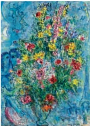
Marc Chagall Bouquet de printemps , c. 1966-67.

La colección posee también un ámbito dedicado exclusivamente al arte internacional con obras de grandes maestros de diversas épocas, entre los que se destacan el flamenco Pieter Brueghel II con su obra El censo en Belén y el inglés, vinculado al romanticismo, Joseph Mallord William Turner con Juliet and her Nurse (Julieta y su aya). Este sector ubicado en un espacio privilegiado del segundo subsuelo alberga las obras más valiosas de la colección, sin duda, uno de los puntos de mayor atracción de la visita.