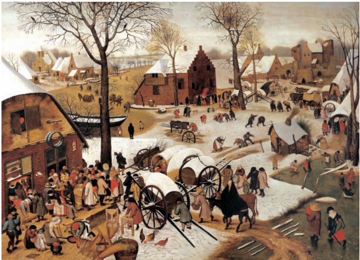
Pieter Brueghel II El censo en Belén , s. f.

La colección posee también un ámbito dedicado exclusivamente al arte internacional con obras de grandes maestros de diversas épocas, entre los que se destacan el flamenco Pieter Brueghel II con su obra El censo en Belén y el inglés, vinculado al romanticismo, Joseph Mallord William Turner con Juliet and her Nurse (Julieta y su aya). Este sector ubicado en un espacio privilegiado del segundo subsuelo alberga las obras más valiosas de la colección, sin duda, uno de los puntos de mayor atracción de la visita.